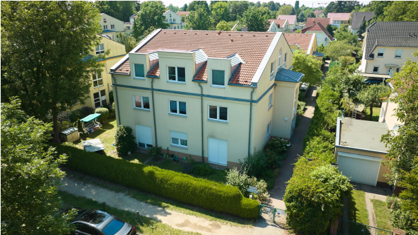
Außenaufnahme Hauseingang straßenseitig