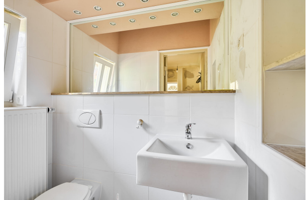
Gäste-WC im Erdgeschoss