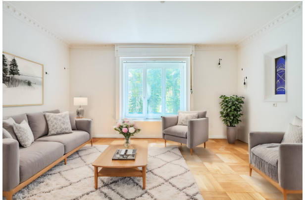
Visualisierung und Einrichtungsidee zum Wohnzimmer