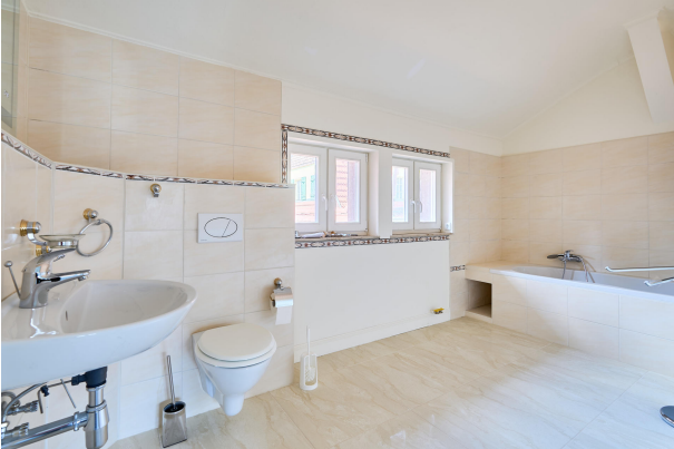
Geräumiges Badezimmer im Obergeschoss