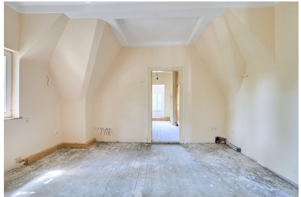
Hauptschlafzimmer mit Umkleidekammer