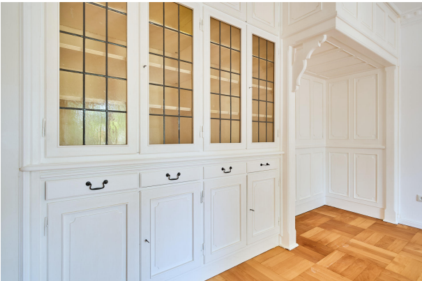
Hochwertige Tischlerarbeiten im Wohnbereich