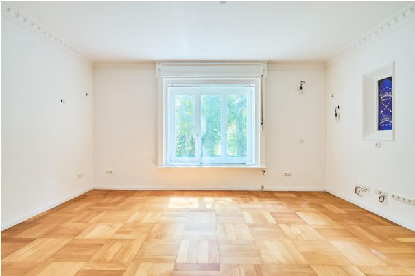
Wohn- oder Esszimmer