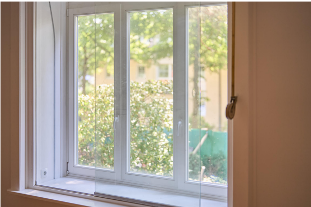
Sanierte Kastenfenster im Wohnzimmer