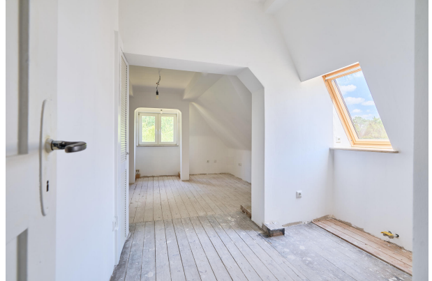
Gemütliches 2. Schlafzimmer im Obergeschoss