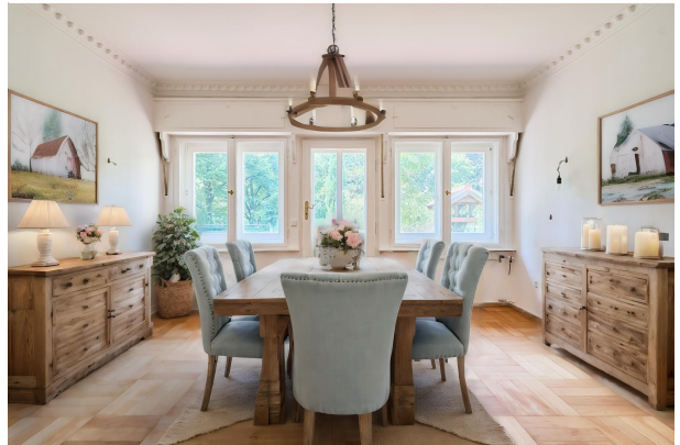
Visualisierung und Einrichtungsidee zum Esszimmer