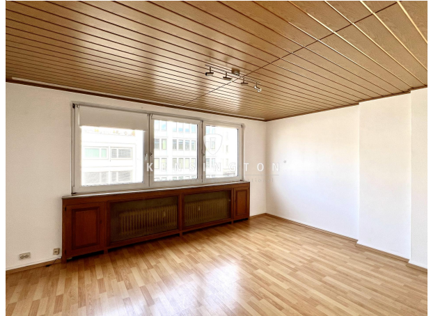
Wohnzimmer - 3. OG