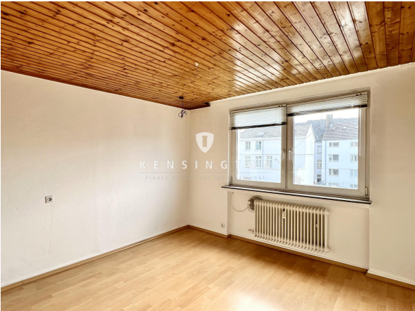
Schlafzimmer - 3. OG