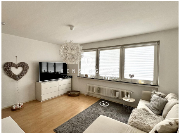
Wohnzimmer - 4. OG