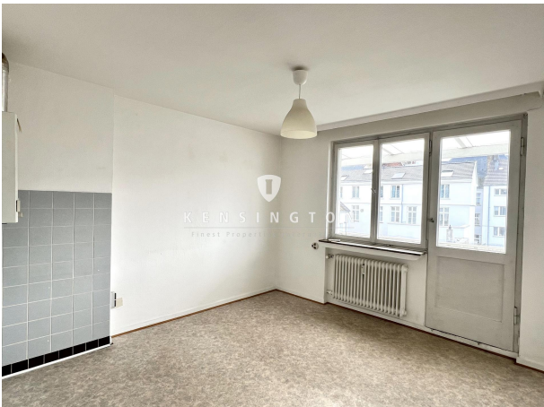
Wohnküche - 3. OG