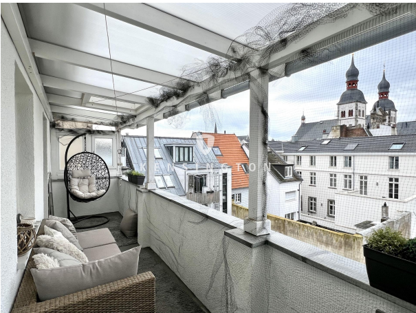
Balkon - 4. OG