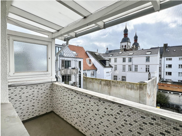
Balkon - 3. OG