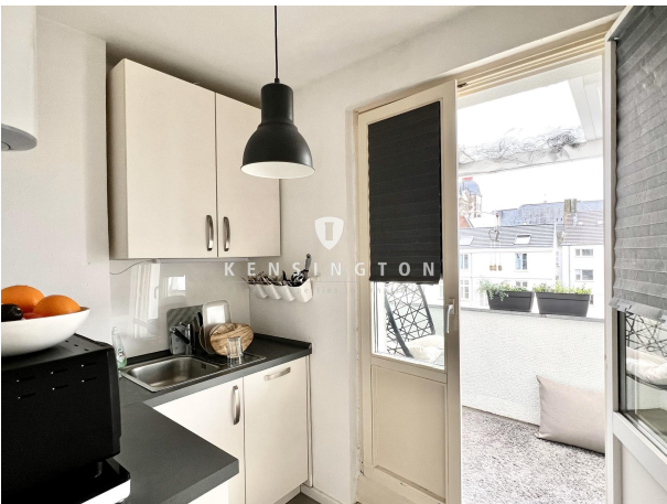
Küche - 4. OG