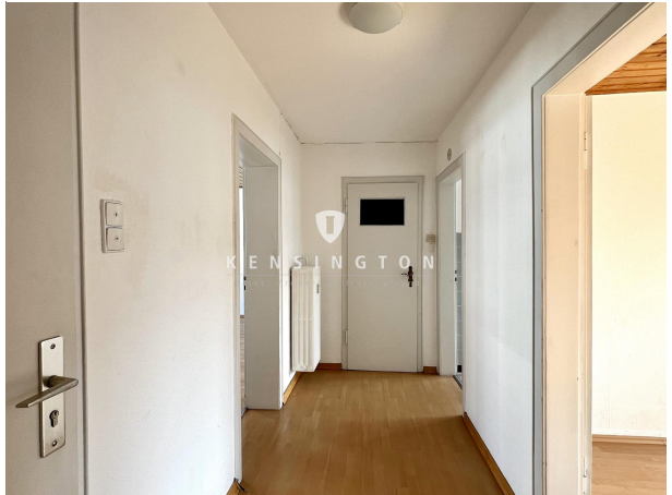
Diele - 3. OG