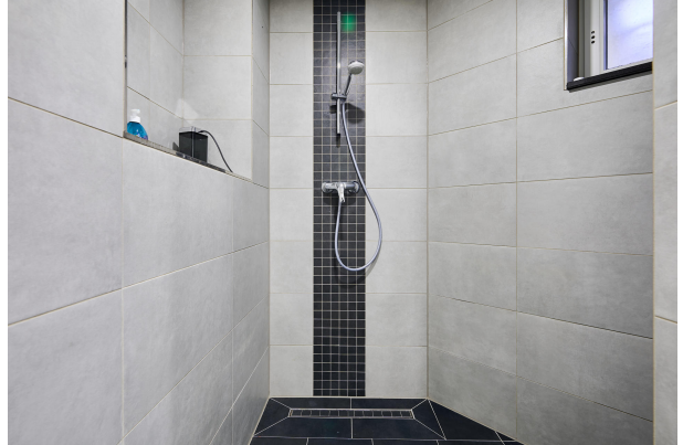
Ca. 160m 2 Souterrain mit Baugenehmigung