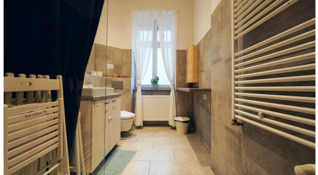
Vierter Raum, der aktuell autark genutzt wird