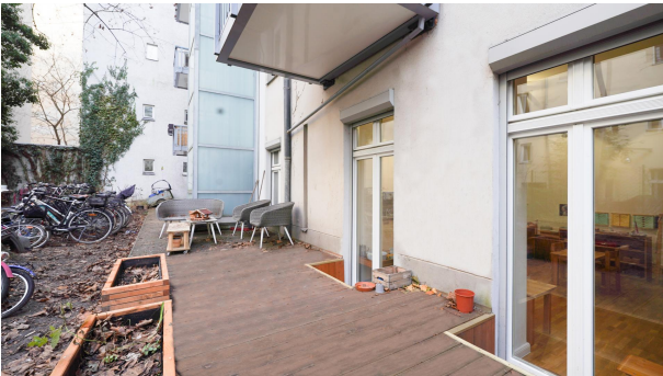
Eine von Zwei Außenflächen