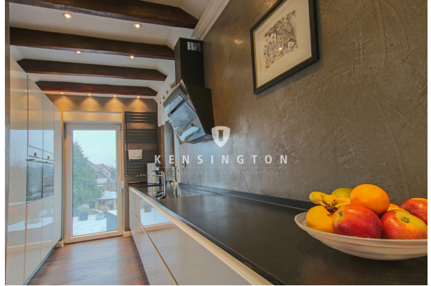
**Küche_KBR_167_Dachgeschosswohnung in Weyhe