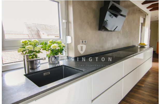
*Küche Ansicht eins