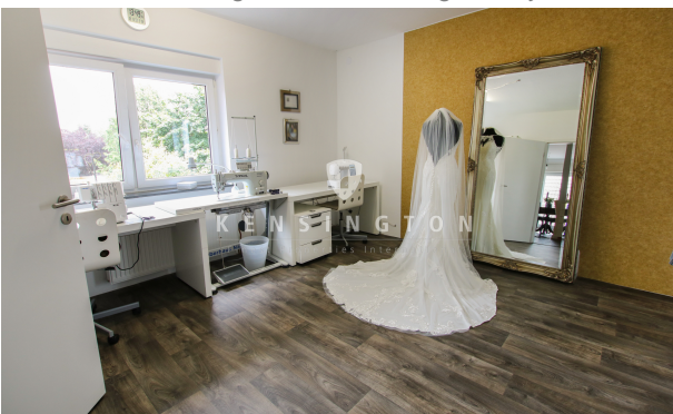
**Schlafzimmer Ansicht 1_KBR_167_Dachgeschosswohnung in Weyhe