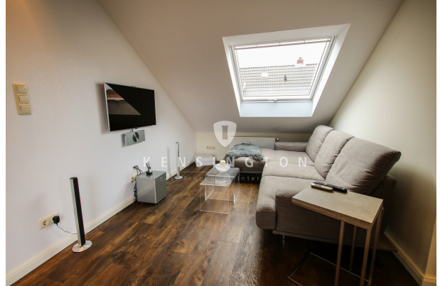
Wohn-/ TV Bereich