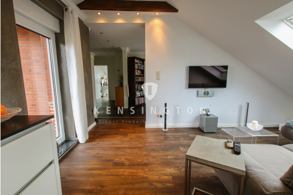
* Flur und Wohn-/ TV Bereich