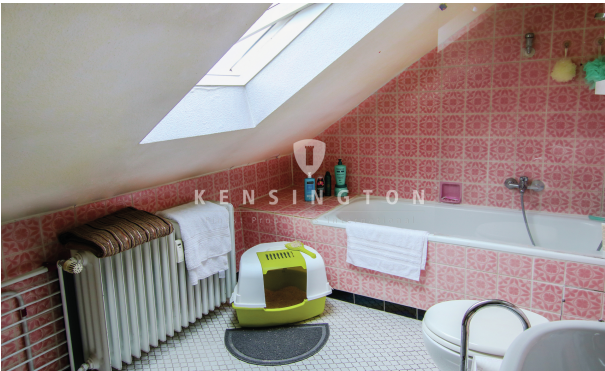
* Badezimmer - Baugenehmigung für Gaube mit mind. 2 Fenstern liegt vor, verlängert bis 2023