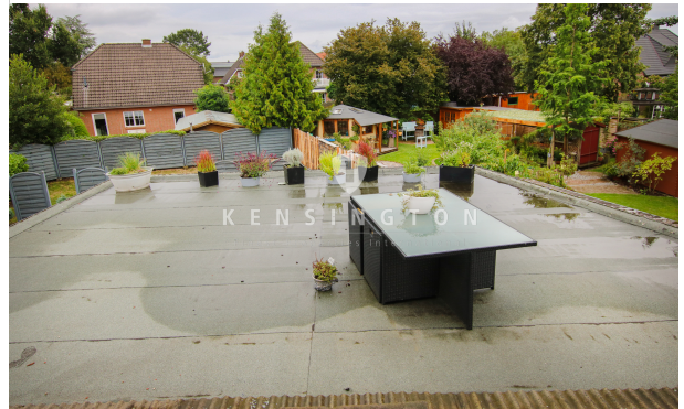
**Terrasse_KBR_167_Dachgeschosswohnung in Weyhe