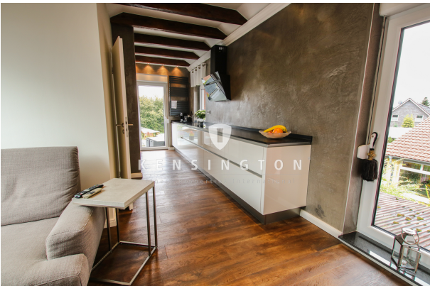
Küche Ansicht zwei