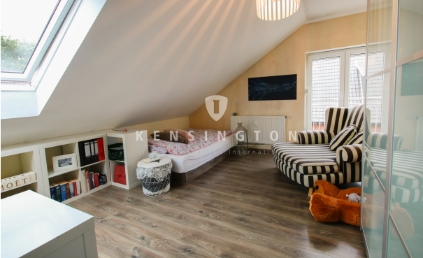
**Kinderzimmer Ansicht 1_KBR_167_Dachgeschosswohnung in Weyhe