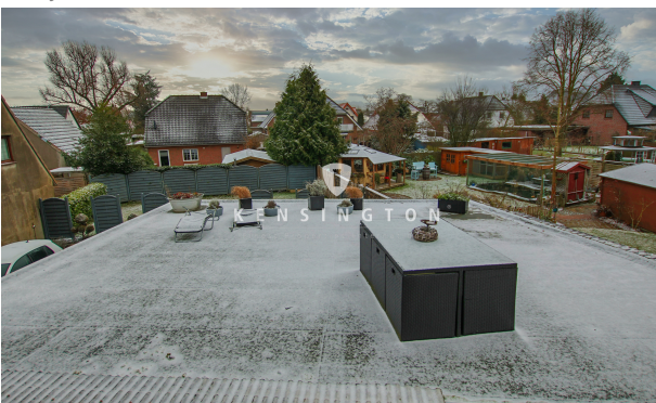
**Dachterrasse_KBR_167_Dachgeschosswohnung in Weyhe