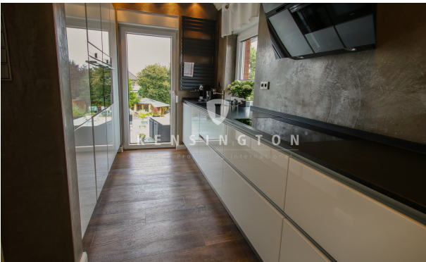
**Küche Ansicht 2_KBR_167_Dachgeschosswohnung in Weyhe