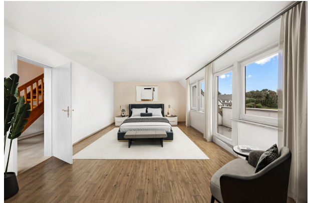
Schlafzimmer im Obergeschoss (Einrichtungsbeispiel)