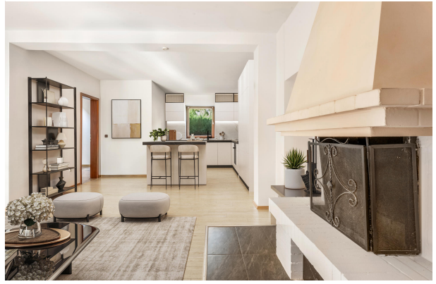
Blick in die Küche (Einrichtungsbeispiel)