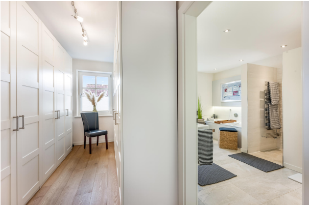
Ankleide mit Blick ins Badezimmer