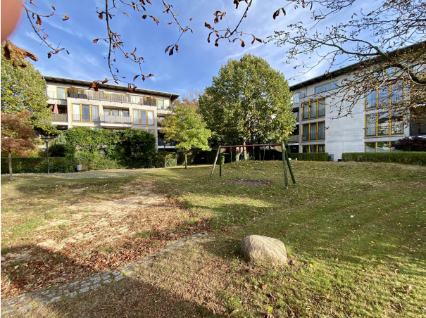
Gepflegter Gemeinschaftsgarten mit Spielplatz