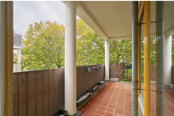
Attraktive Terrasse für die schönen Sommertage