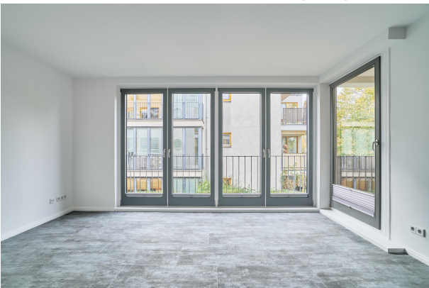
Wohn- Essbereich mit vielen Gestaltungsmöglichkeiten