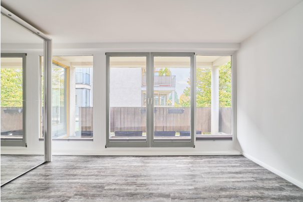
Schlafzimmer mit Zugang zur Terrasse