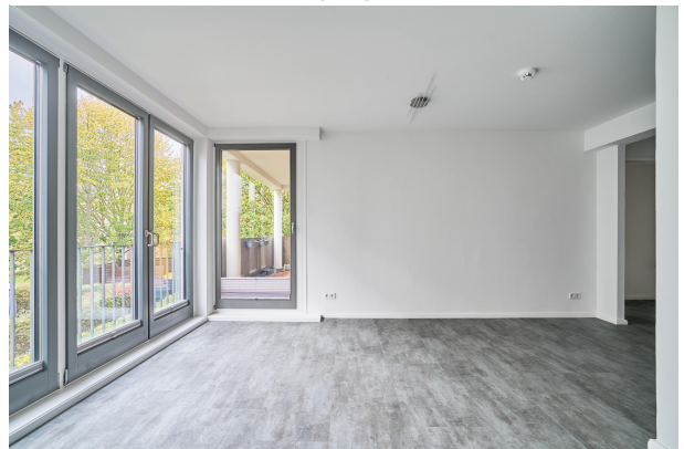
Wohn- Essbereich mit Zugang zur Terrasse