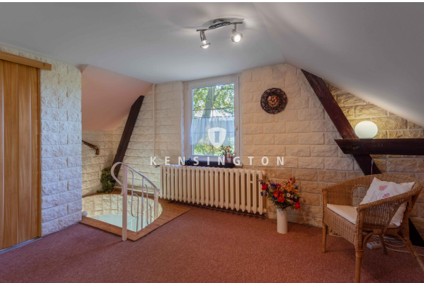
Zimmer 3 im Dachgeschoss