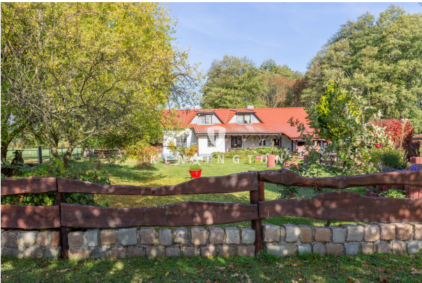
Haus vorderer Garten