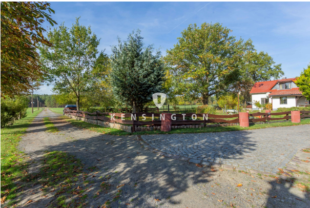
Blick zum Grundstück