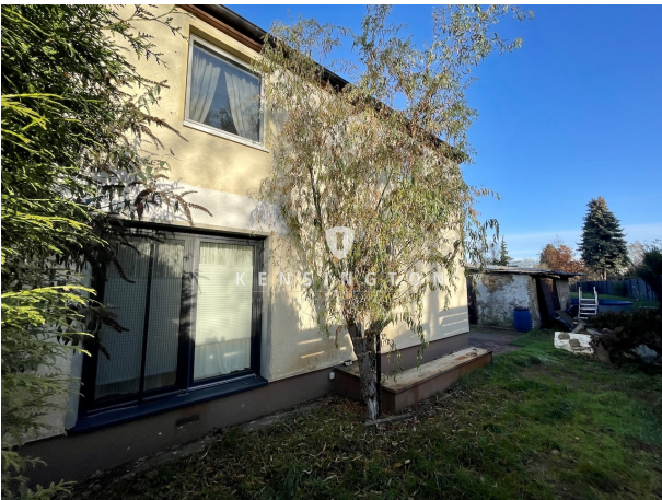
Rückseite vom Haus