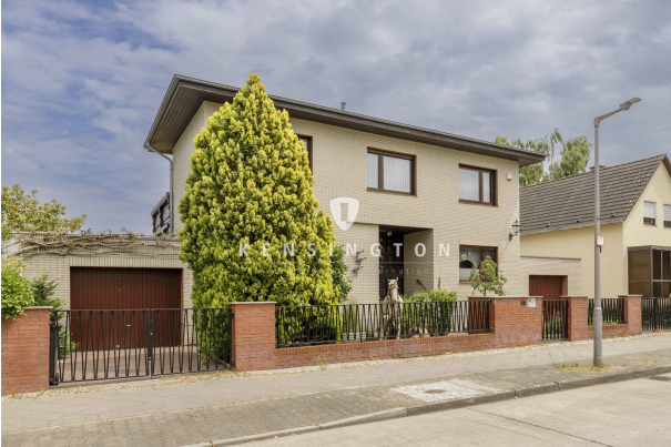
Wohnhaus von der Straße