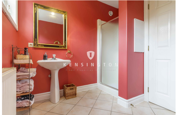
Duschbad im Erdgeschoss