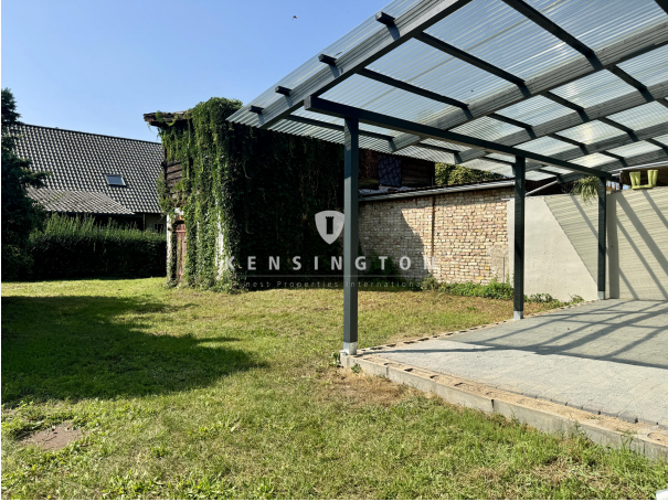
Schuppen und überdachte Terrasse