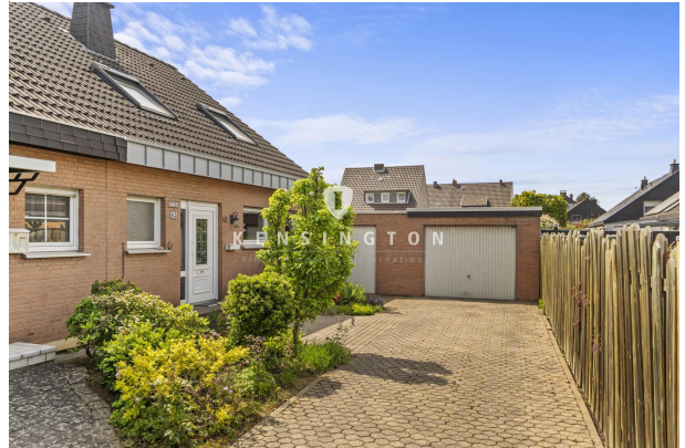
Stellplätze und Garage