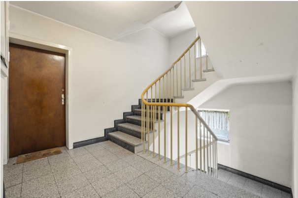
Treppenhaus Haus 1