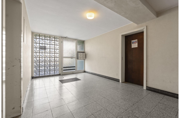
Flur Haus 1