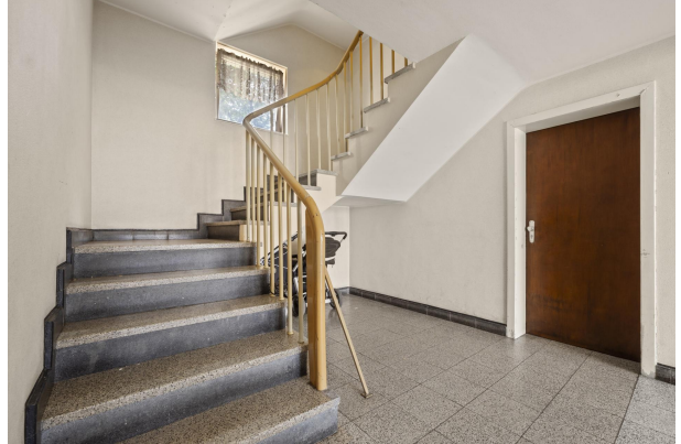
Flur Haus 1