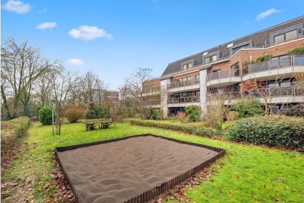
Gemeinschaftsgarten direkt am Kittelbach