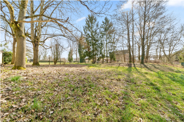
Ansicht 1 Grundstück