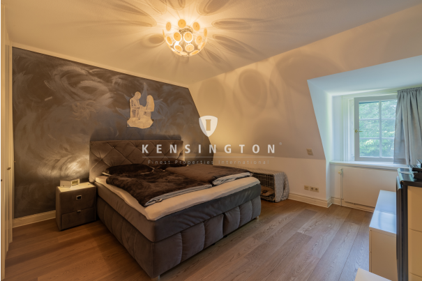
DG - Ankleidezimmer