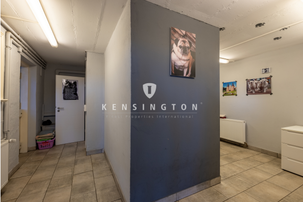
EG - Aufenthaltsraum