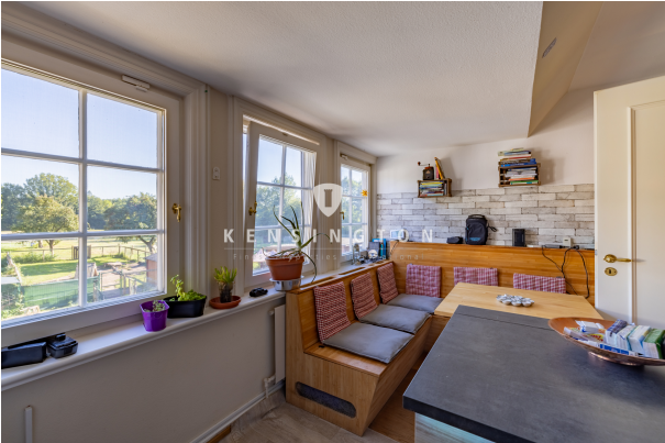
Schmidt - Nieselke