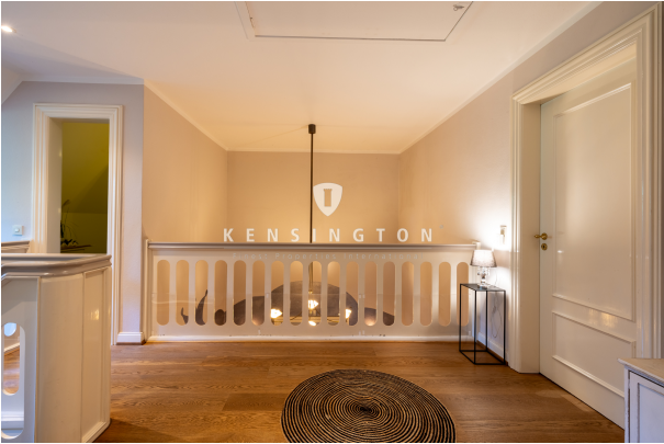
DG - Galerie