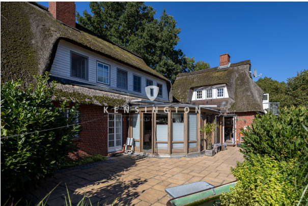
Rückansicht - Kleine Terrasse