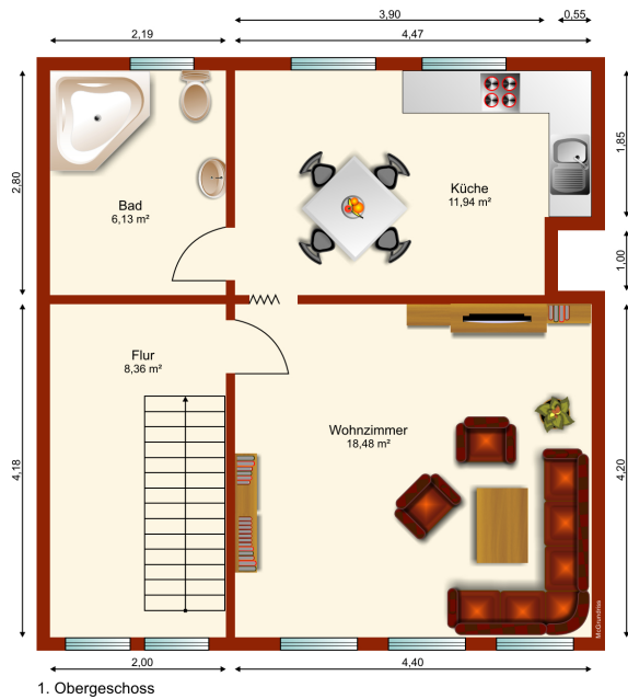
Grundriss 1. Obergeschoss Hinterhaus