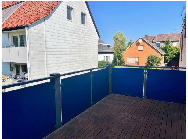
Balkon 1. Obergeschoss