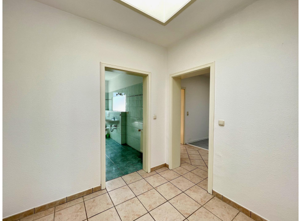
Eingang Wohnung 1. Obergeschoss