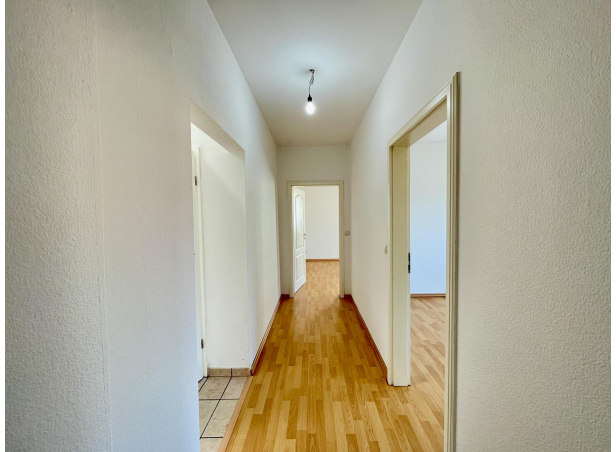
Flur 1. Obergeschoss