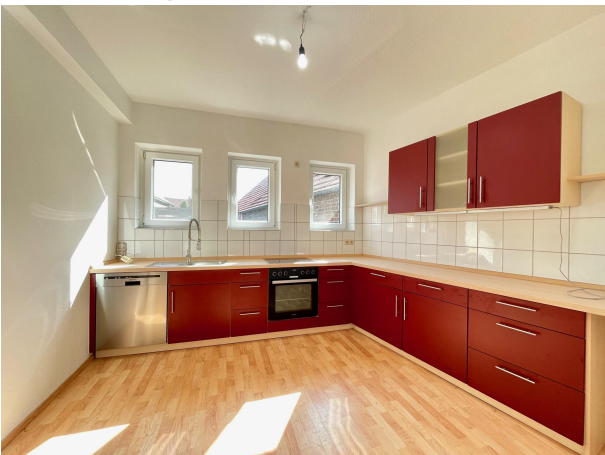
Küche 1. Obergeschoss