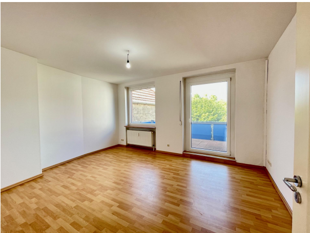
Wohnzimmer 1. Obergeschoss