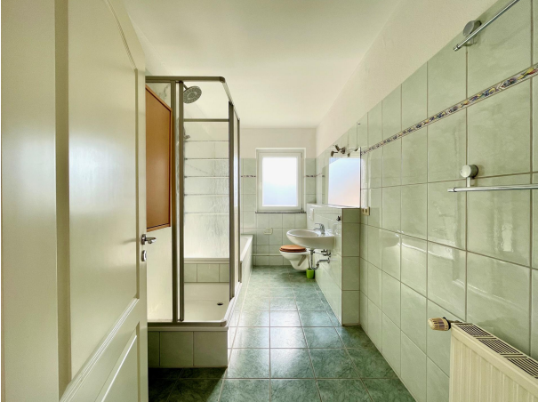
Badezimmer 1. Obergeschoss