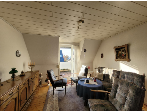
Wohnen Haus 1 DG