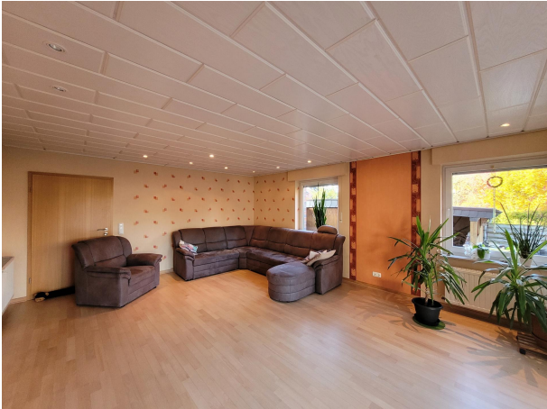
Wohnen Haus 2