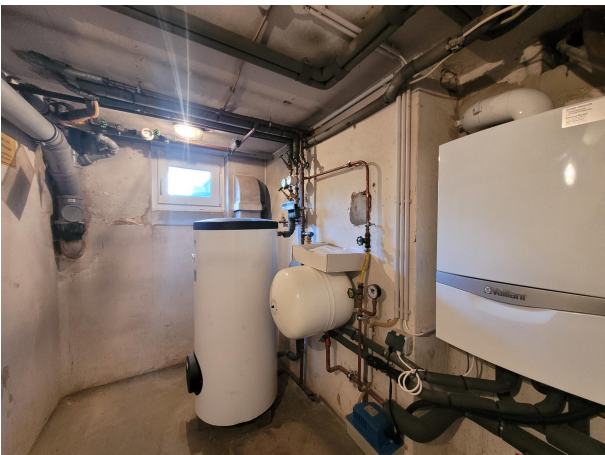
Keller Haus 1