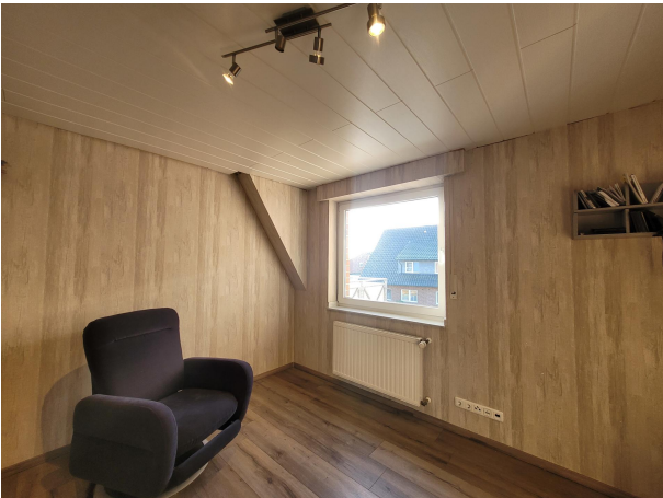
Kind Haus 2