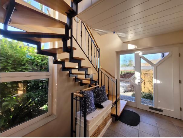
Flur Haus 2