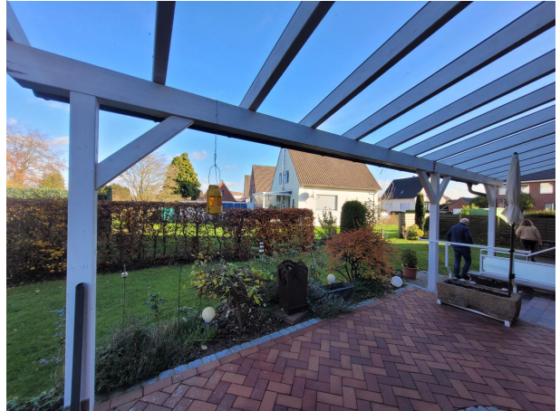
Veranda Haus 2