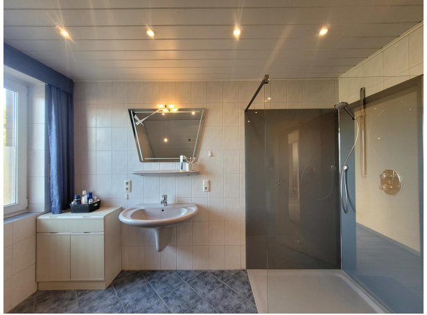
Bad Haus 2