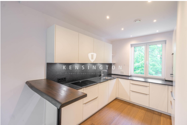
Stilvolle Einbauküche mit Marken-Geräten