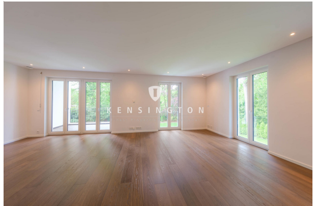
Viel Platz im hellen Wohnzimmer