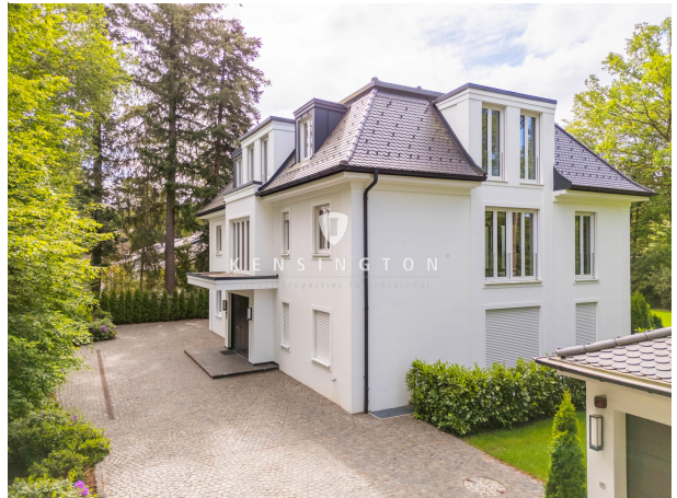
Zauberhafte Wohnung im 1. Ober- und Dachgeschoss