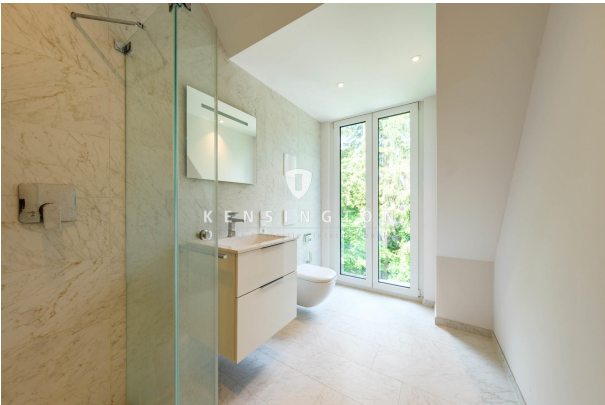
Modernes zweites Badezimmer im DG