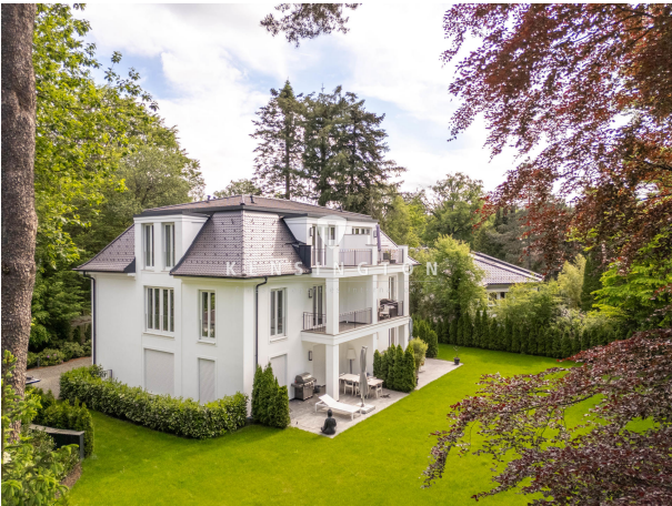
Großzügiges Wohnen im Grünen