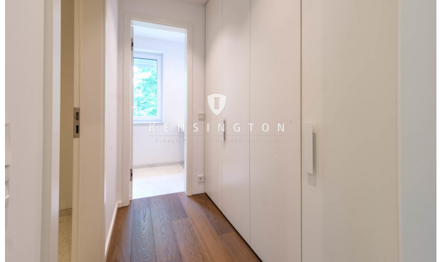
Hochwertige Garderobe mit Einbauschränken von Böhler