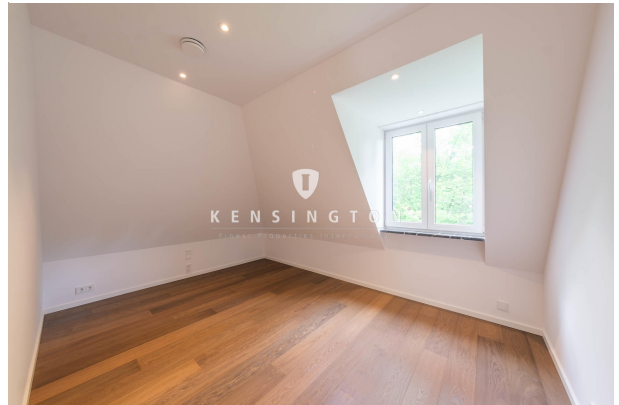
Drittes Schlafzimmer oder Büro im DG