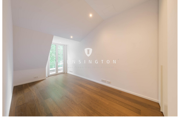
Zweites Schlafzimmer mit Bodentiefen Fenstern im DG