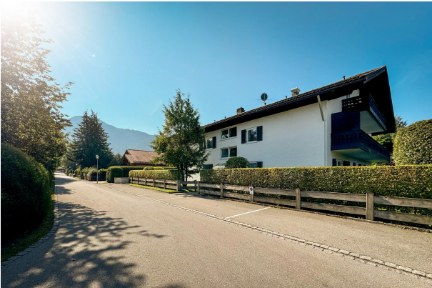
Hausansicht von der Straße aus