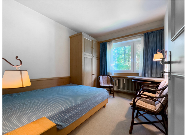
behagliches Gäste- oder Arbeitszimmer