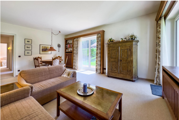
Zugang zu der Terrasse vom Wohnzimmer