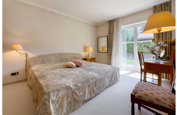
großes Elternschlafzimmer mit Zugang zur Terrasse