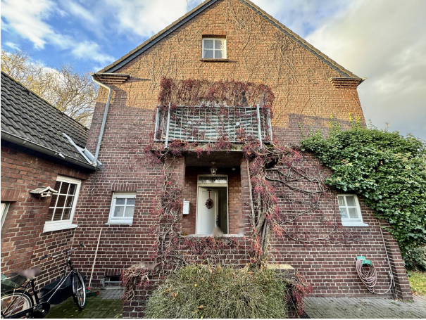
Hauseingangsbereich Giebel links