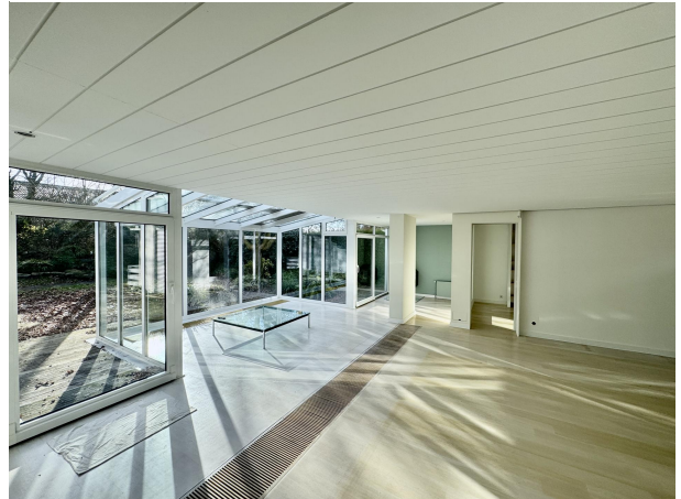
Wohnzimmer Blick Kamin und Wintergarten