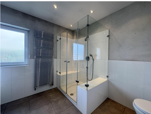
Masterbad mit Dusche