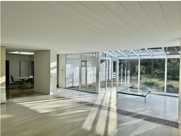
Wohnzimmer Blick Terrasse und Essbereich