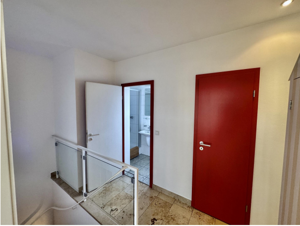
Diele Keller & Gäste WC mit Dusche