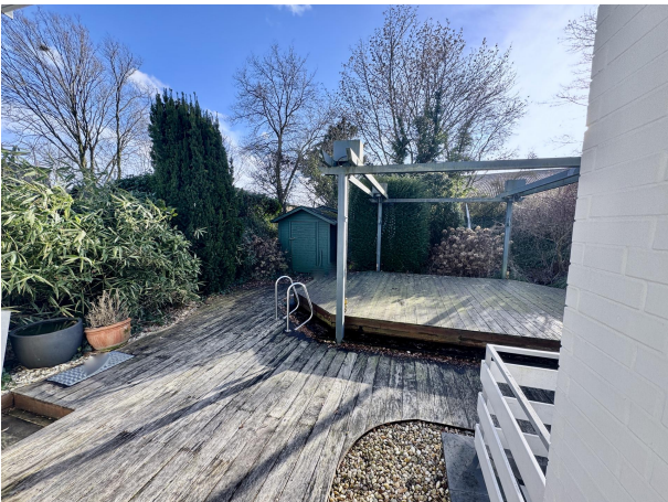
Blick v. Schlafzimmer Terrasse