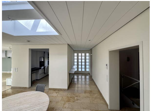
Flur Blick Eingang und Küche