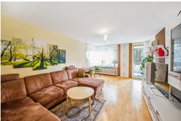
Wohnzimmer mit Zugang zum Balkon