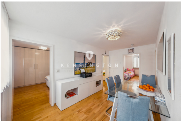
Esszimmer mit Blick ins Schlafzimmer