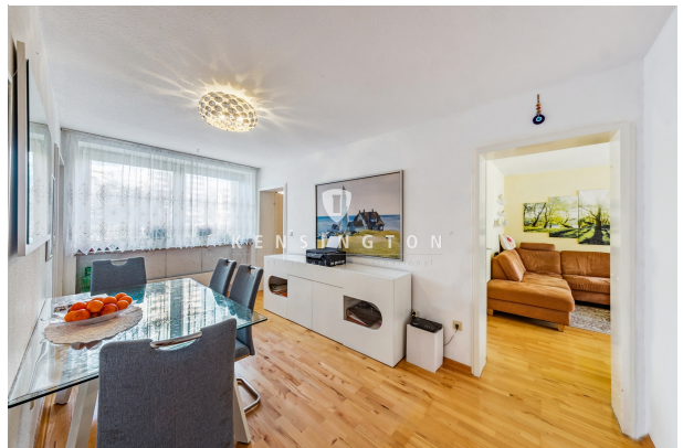
Esszimmer mit Blick ins Wohnzimmer