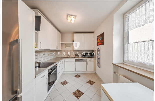
Küche mit Blick in den Innenhof