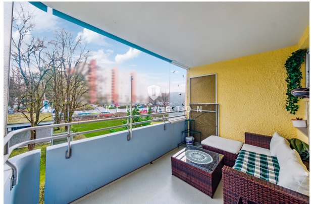
Balkon mit Süd Ausrichtung