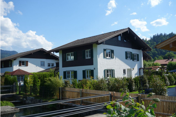
Außenansicht mit Bachlauf