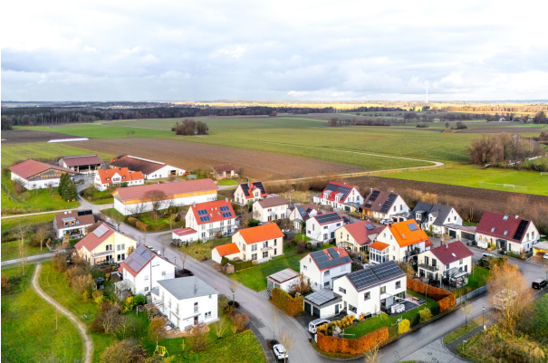
Ansicht auf Vierkirchen