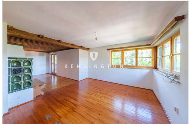
Wohnbereich von der Küche aus gesehen