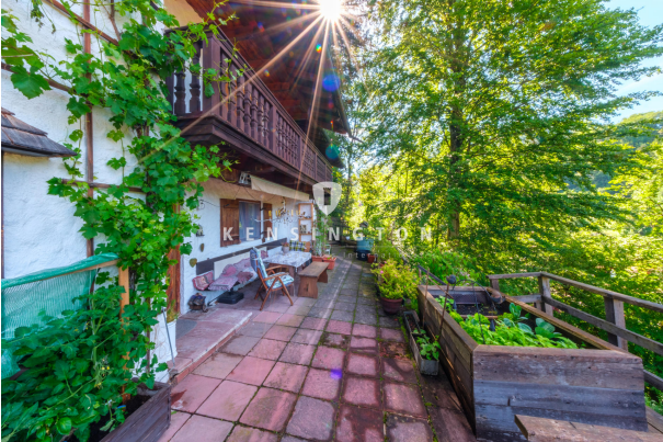
Terrasse Blickrichtung Osten