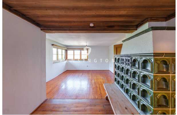
Wohn/Essbereich mit Kachelofen