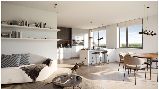
Wohnung Nr. 1