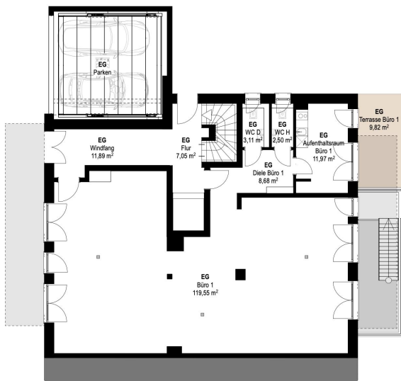
Grundriss EG m1:100