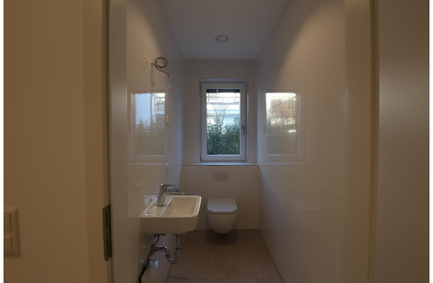
WC 2 EG