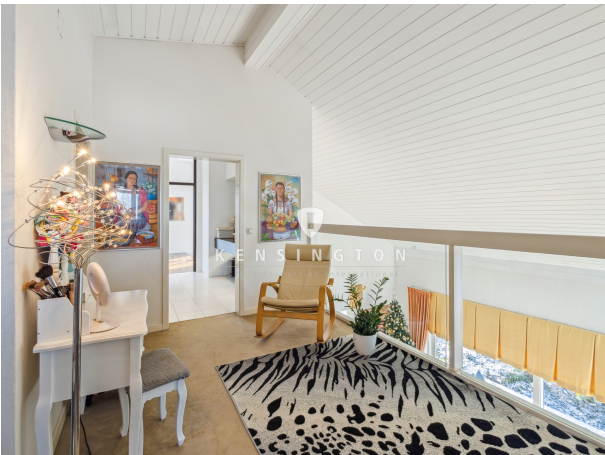
Kinder- o. Gästezimmer