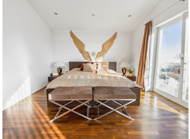
Schlafzimmer mit Ankleide