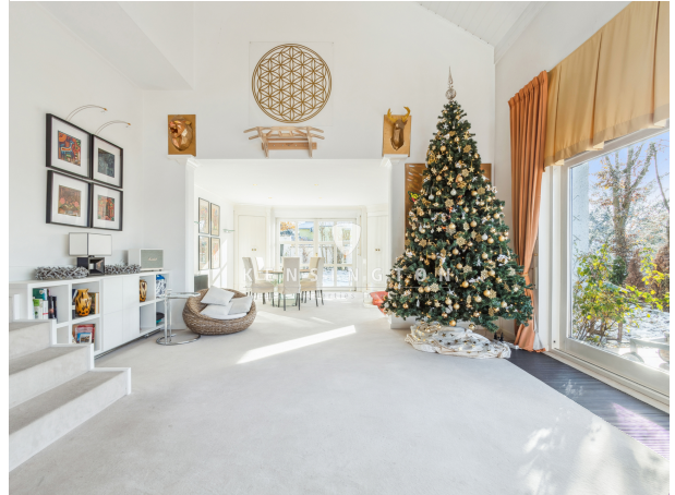
Kaminlounge der Extraklasse