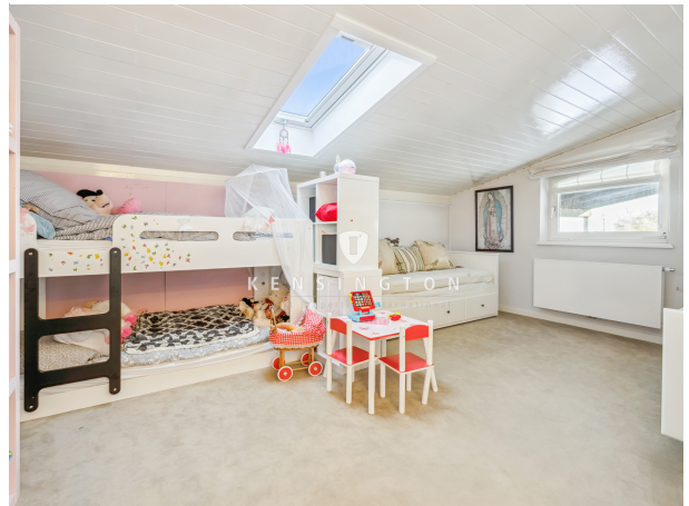
Ankleide Kinder- o. Gästezimmer