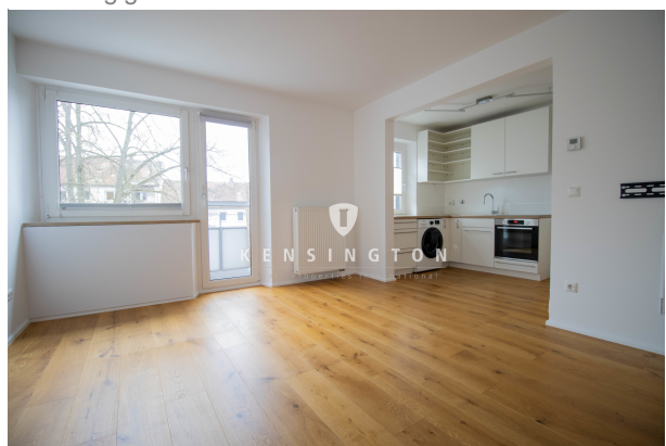
Großzügig & freundlich