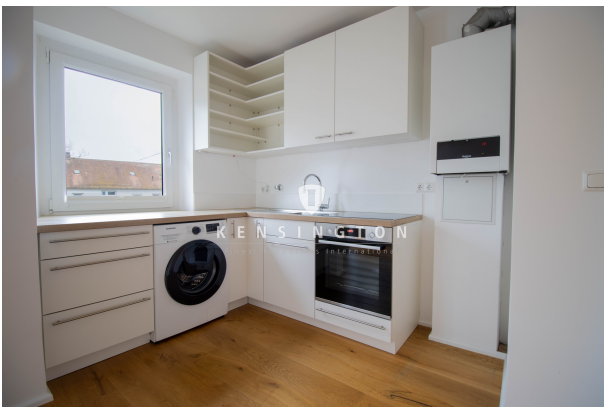
Schreiner-Einbauküche inkl. Waschmaschine