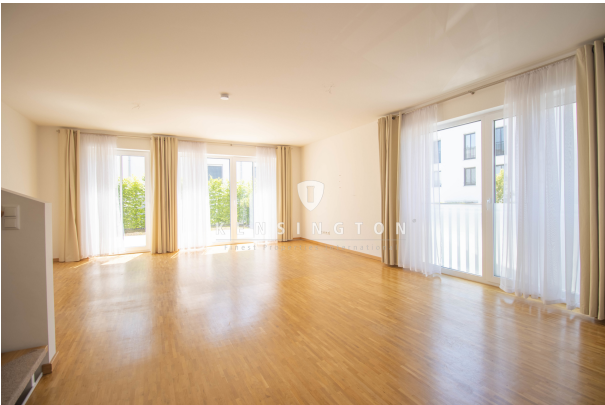
Für Freunde & Haustiere