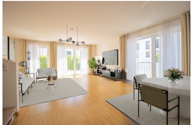
Staging Wohnen & Essen