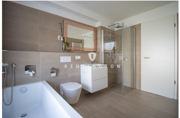
Inkl. Badwanne & Regendusche