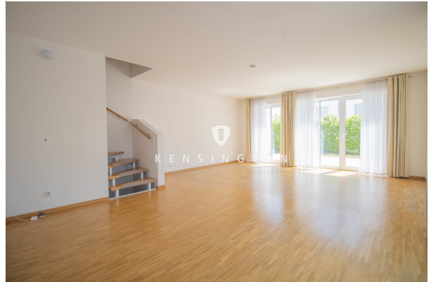
Platz für eine große Familie