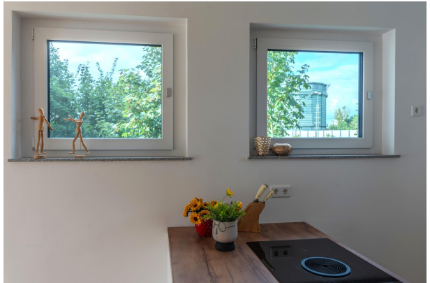
Detailfoto aus der Küche!