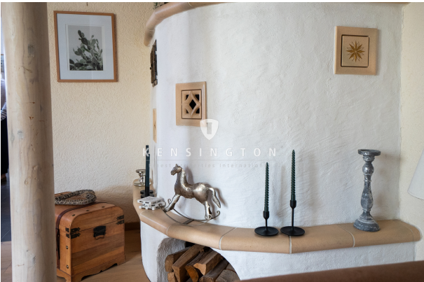
Für eine schöne Frühlingszeit!