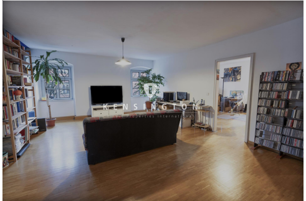
Blick ins Grüne!