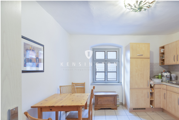
Mit Platz für einen großen Esstisch!