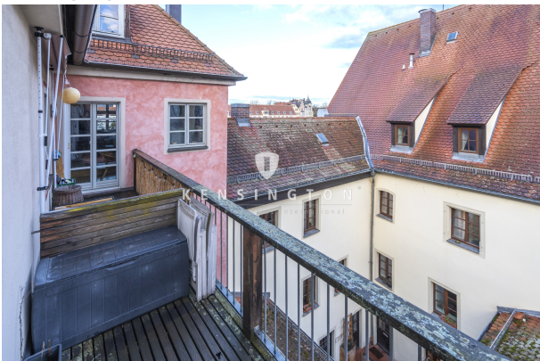
Mit Zugang zum Balkon!