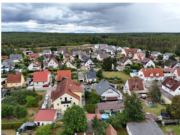
Willkommen in Rednitzhembach!