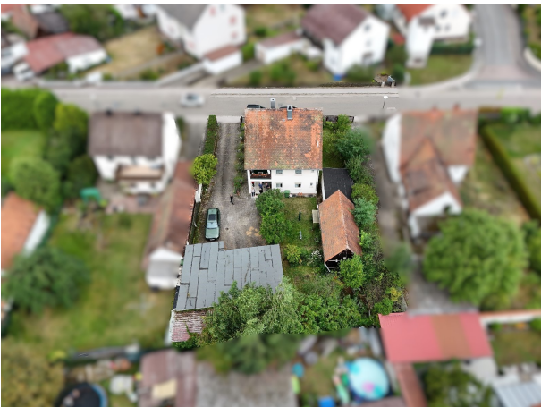
DHH, MFH möglich!