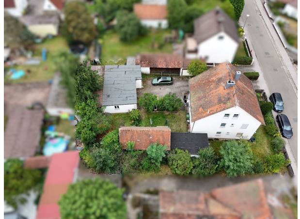
Nachbarschaft aus Alt-/Neubau!