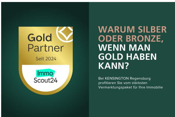
Gold Partner - ImmoScout24