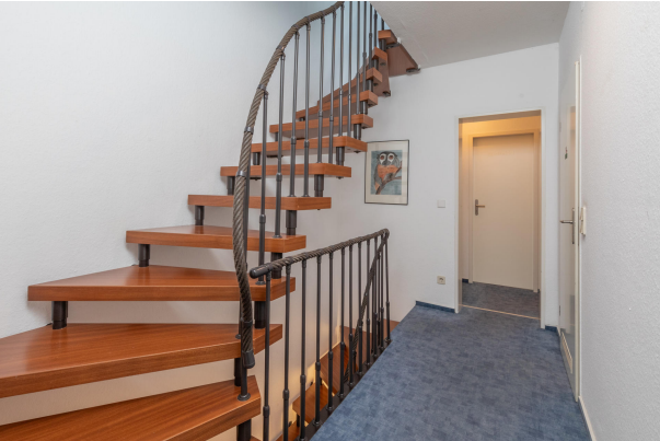
Flur 1. Obergeschoss