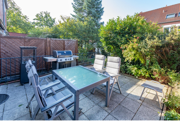
Terrasse s/w Ausrichtung