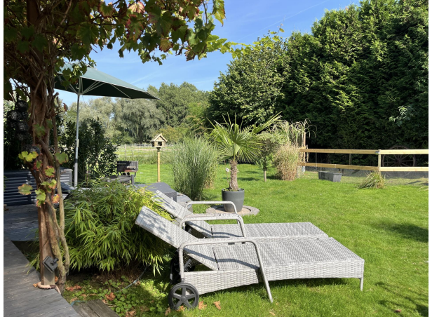
Ruheoase mit Pferden im Garten Wohnung EG rechts