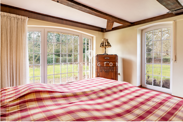
Gästezimmer mit Rundumblick in den Garten