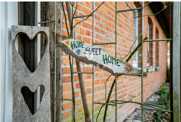
Home Sweet Home