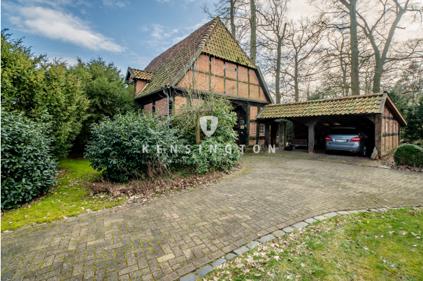
Kleine Scheune und Remise für Ihren Fuhrpark