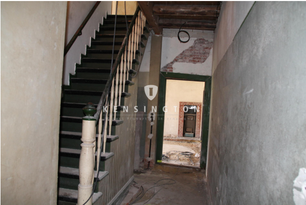
Treppenhaus nach dem Entkernen