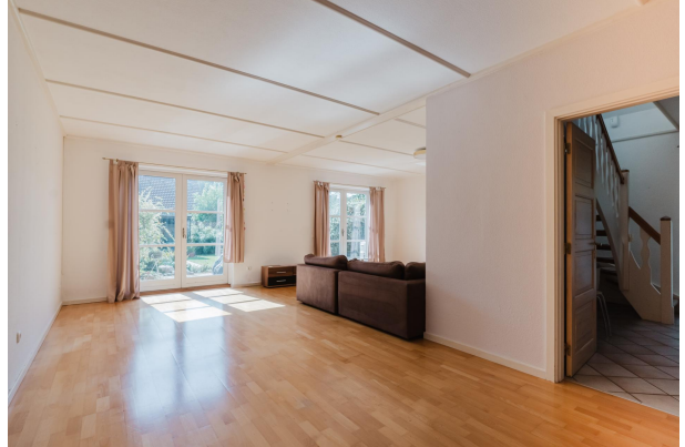
Offenes Wohn- und Esszimmer