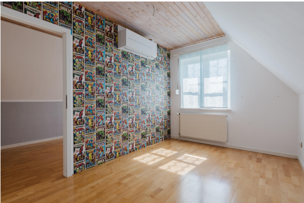
Willkommen in Ihrer Wohlfühloase