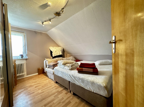
Zimmer OG ELW