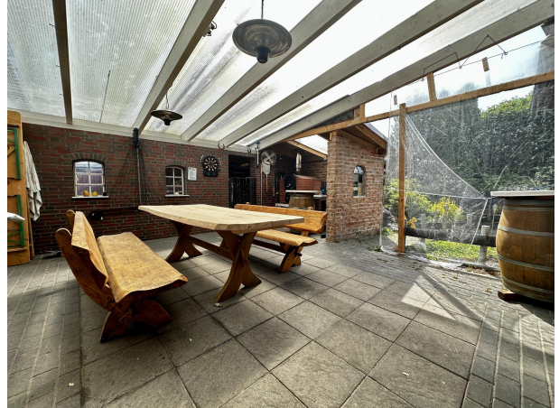
Überdachte Terrasse Haupthaus