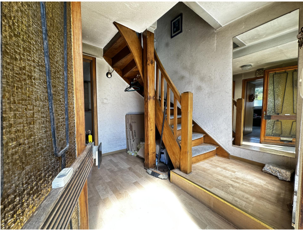
Flur / Eingang