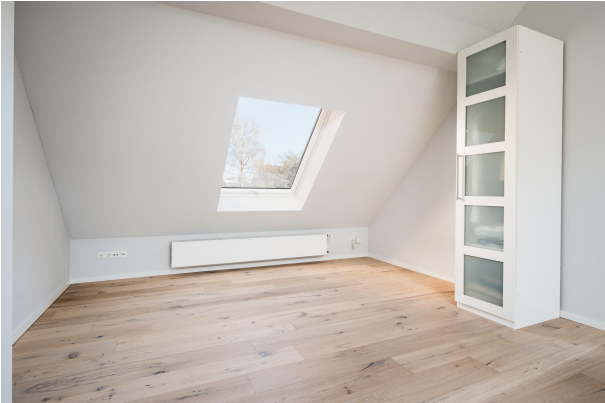
Möblierte Impression - Zimmer II